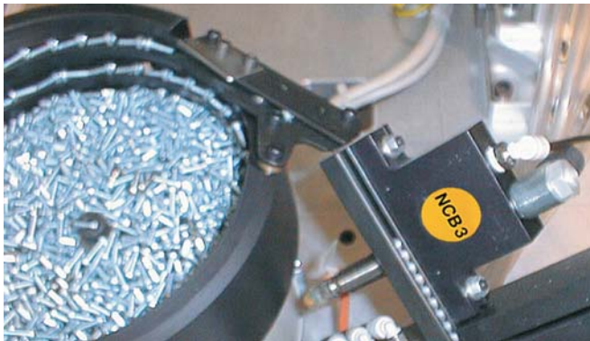
Sortieren und Ausrichten

* Anreißmaße für waagerechte Befestigung, Bohrung ØE