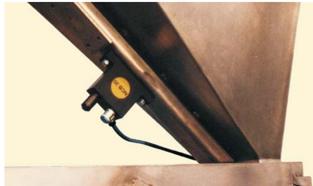
Entleeren ohne Brückenbildung