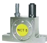
Wibrator pneumatyczny wirujący