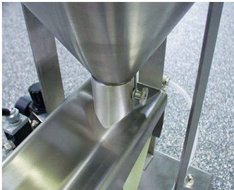
Dispositif de dosage à la sortie du réservoir