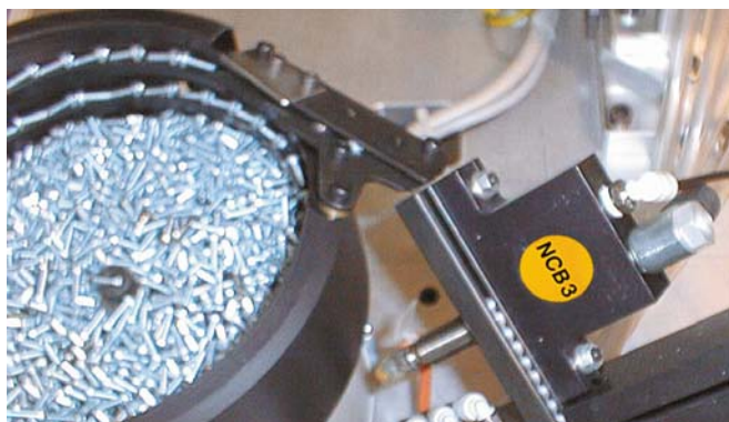
Sortowanie i pozycjonowanie

*Wymiary dotyczące otworów do montażu poziomego ØE