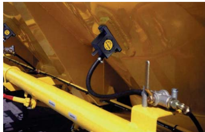
Entleeren von Silofahrzeugen