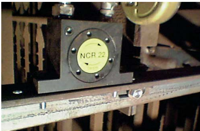
Abreinen von Filterdrähten