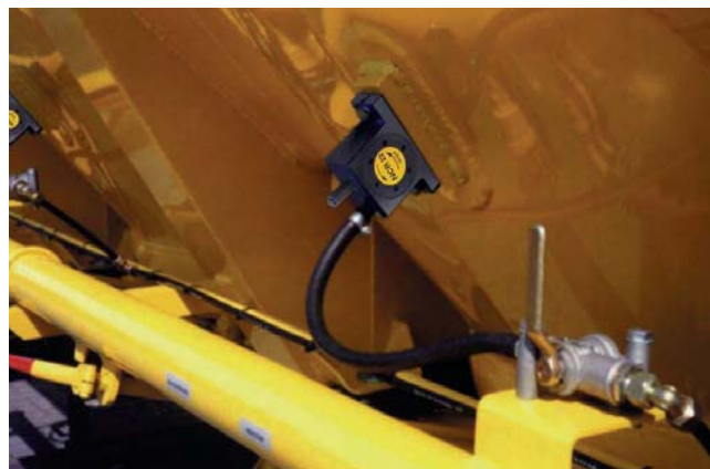
Vidage de véhicules-silos