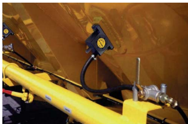
Opróżnianie cysterny samochodowej