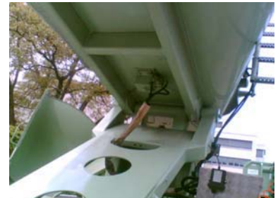
NHG 900 L