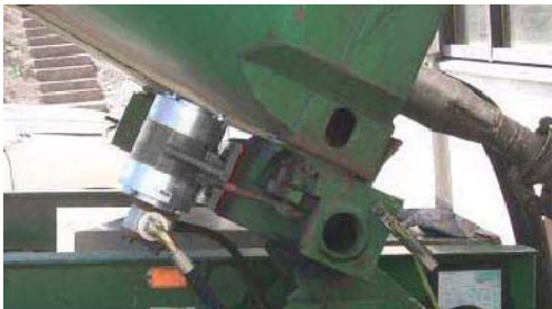
NHG 3000 L