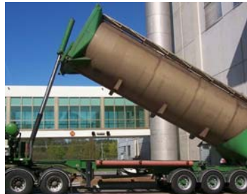
Vidage de véhicules-silos