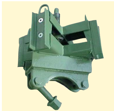
Spannkreuz mit Spindelverstellung