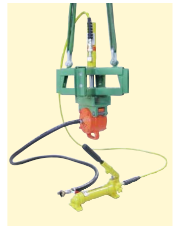
Spannkreuz mit Hydraulikzylinder