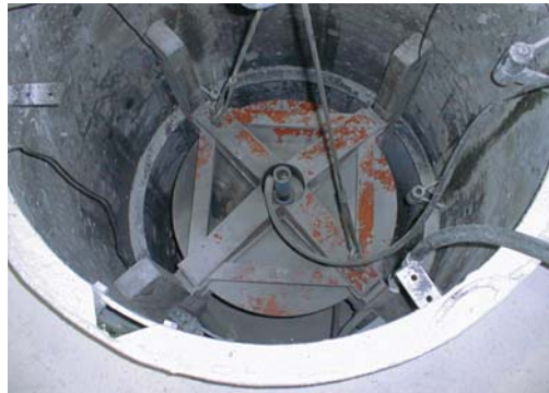
Ofenzustellung mit NKH