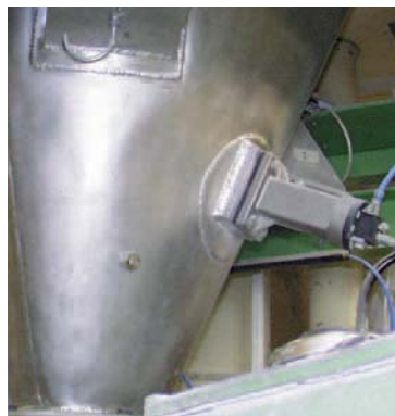
Décolmatage de parois de silos