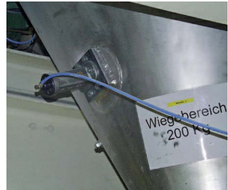
Décolmatage de réservoirs de pesage