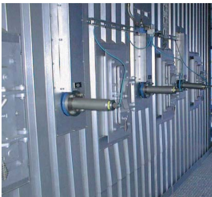
Nettoyage d'éléments de filtre

Dès que l'air comprimé est amené à la fixation VAC, l'unité est fixée par l'intermédiaire de ses ventouses et assure une liaison parfaitement adhérente entre le percuteur et son support. Des fixations ATEX et des appareils à plaque inox sont également disponibles.