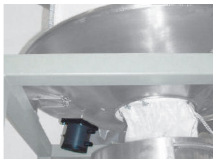
NTS 50/04 als Austragshilfe am Big Bag