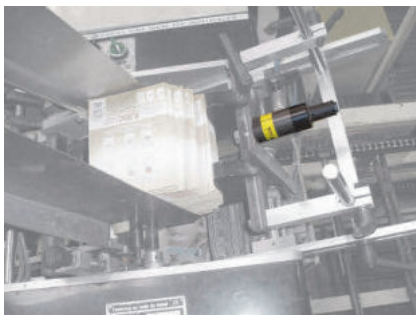
NTS 250 zum Einordnen von Printpublikationen