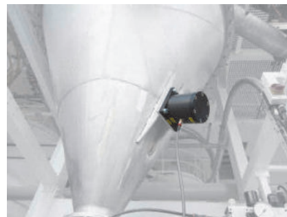
NTS 54/02 zur Verbesserung des Materialflusses