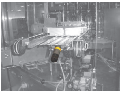
NTS 180 zum Etikettieren von Flaschen