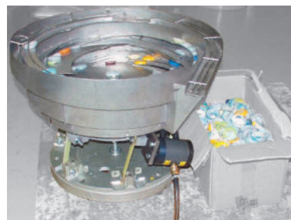
NTS 100/01 zum Wendelfördern von Schüttgut