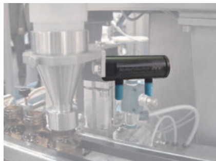
NTS 80 zum Befüllen von Fläschchen